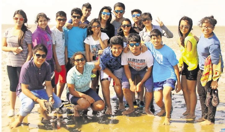
Bei ihrem Ausflug ins Watt erfuhren die indischen Schüler jede Menge Wissenswertes über die vielen verschiedenen Organismen, die hier heimisch sind.

„Die Gruppenarbeiten verliefen ohne Problem, denn die Sprachbarrieren wurden schnell überwunden. Die indischen und deutschen Schüler gaben durchweg positive Rückmeldungen“, sagt Heike Keuser, Lehrerin am