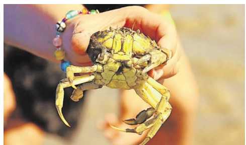
Das Verbreitungsgebiet der Strandkrabbe erstreckt sich von Nordnorwegen bis zur Atlantikküste Nordafrikas – in Indien wurde sie noch nicht gesichtet.

Wer mehr über ihren Aufenthalt erfahren möchte, kann ihr Tagebuch in Form eines Blogs im Internet verfolgen. (red/may) https://indogerman16.wordpress.com/