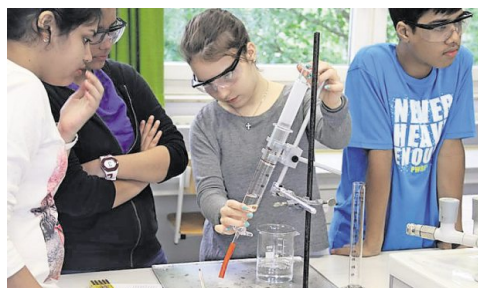
Wasseranalyse: Die Gruppen lernten die verschiedenen Eigenschaften des Wassers kennen.