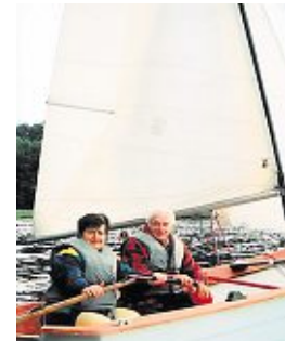
Unterwegs mit dem Boot am Oder-Warthebogen.